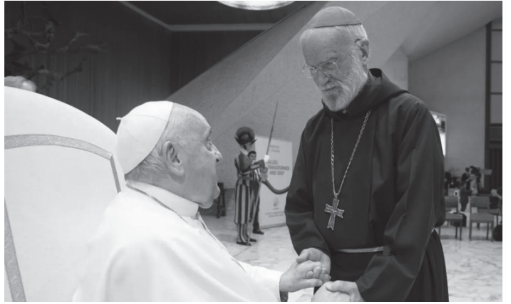
カンタラメッサ枢機卿をねぎらう教皇フランシスコ (カリス公式サイト charis.international より)