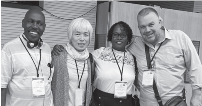
2019年リーダー研修会参加者と再会。 現在は左からウガンダ、日本、セーシェル、 クロアチアのコーディネーター。