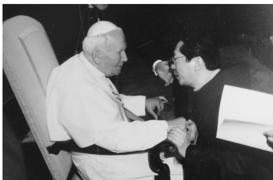
ヨハネ・パウロ2世と謁見する小平神父（1999年）