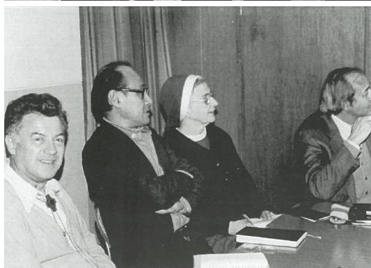
草創期の思い出から

ってきたのは夜、休もうと横になっていて時でしたので、とてもリラックスしていたと思います。